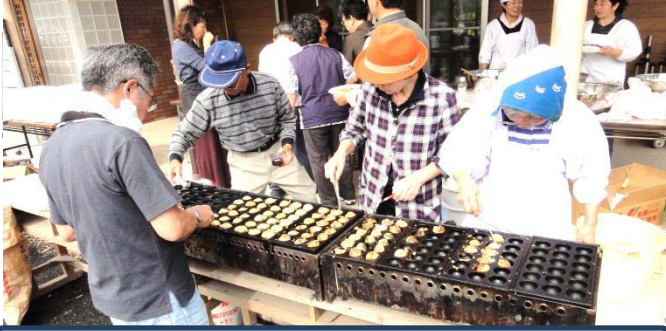
今年もあります！「たこ焼き」&「焼き鳥」

お天気の関係で室内になりましたが、多くの方に三芳に来ていただき、真新しい建屋での感謝祭は、一体感のある素晴らしいものになりました。 前日からの準備、また会員の方から、たくさんのご奉仕をいただき、大変ありがとうございました。