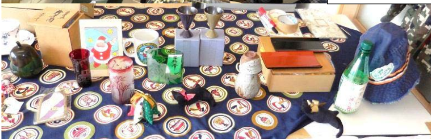
食べる会の方のフリーマーケット