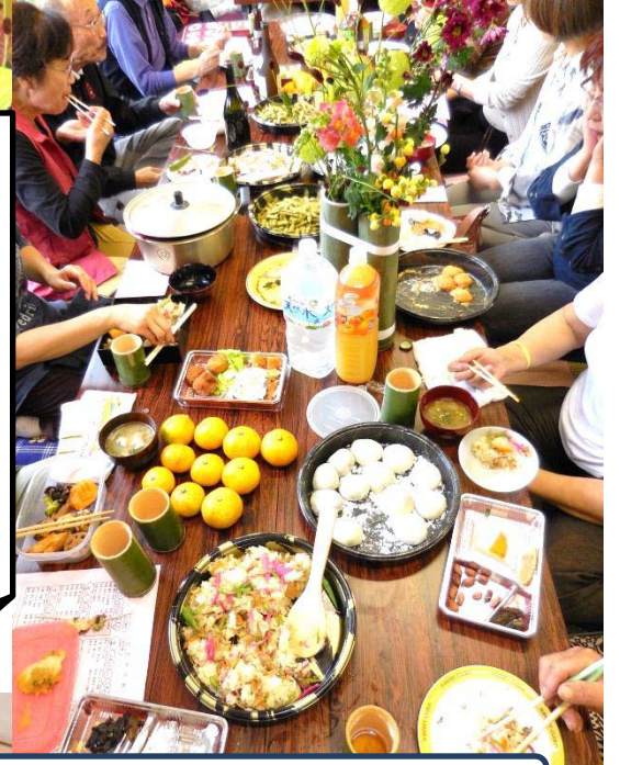
食べ物でテーブルの上はいっぱいですね！

お天気の関係で室内になりましたが、多くの方に三芳に来ていただき、真新しい建屋での感謝祭は、一体感のある素晴らしいものになりました。 前日からの準備、また会員の方から、たくさんのご奉仕をいただき、大変ありがとうございました。