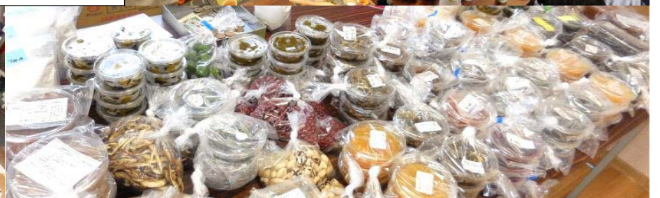
生産者の加工品（通常は販売していないものばかり！）